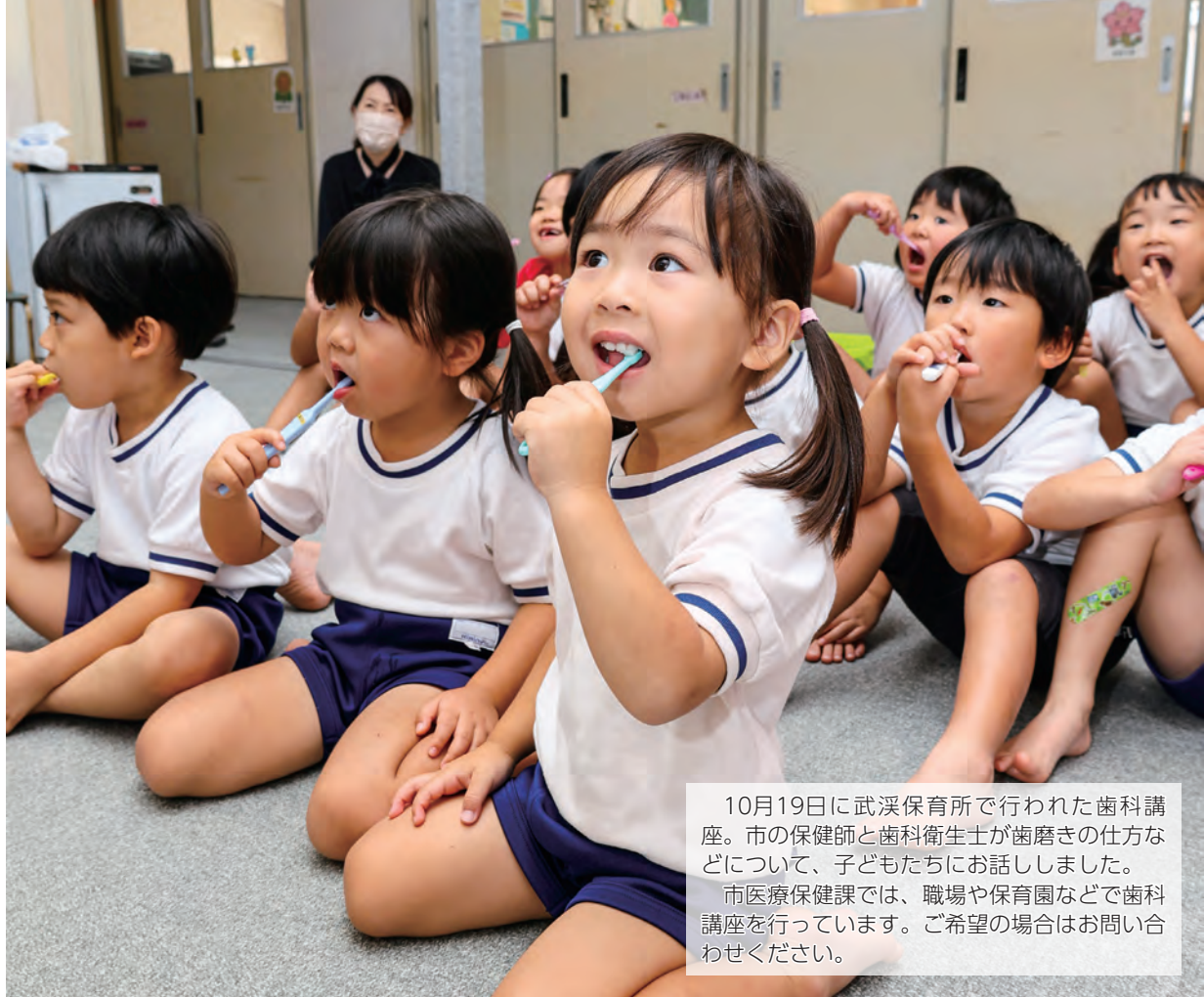
10月19日に武漢保育所で行われた歯科講座。市の保健師と歯科衛生士が歯磨きの仕方などについて、子どもたちにお話しました。市医療保健課では、職場や保育園などで歯科講座を行っています。ご希望の場合はお問い合わせください。