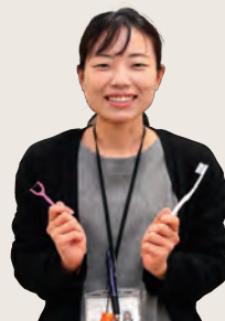
「お口のケアを大切に」

市が行ったアンケート調査によると、平成29年度と令和2年度の比較で、歯が20本以上ある市民の割合が全体的に減少しています。内訳をみると、比較的若い年代（20～59歳）の歯の健康状態が特に悪化していることがわかります。市民の歯の健康意識を高めるため、市は幼少期からの歯に関する教育や、定期歯科検診の受診などを推進しています。